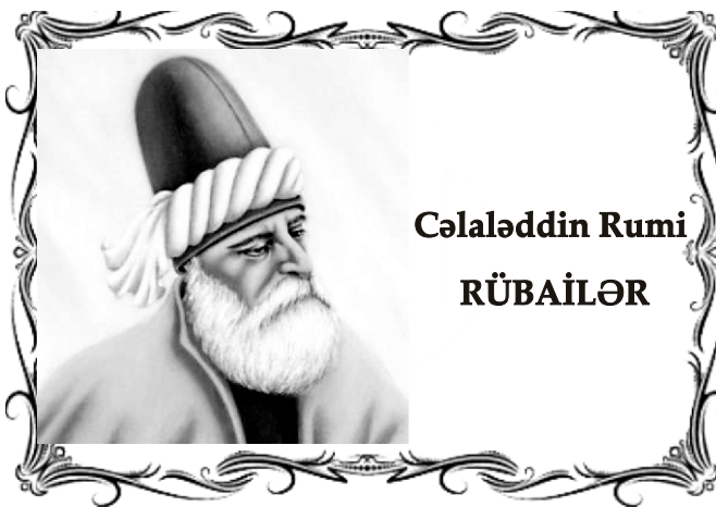
Cəlaləddin Rumi RÜBAİLƏR

Dünyada məşhur olan mütəfəkkir şair Mövlana Cəlaləddin Rumi ("Rumi" təxəllüsü ona Anadoluda (o vaxtlar Anadolu "Diyari - Rum" adlanırdı) yaşadığı üçün, "Mövlana" ("bizim ağamız") titulu isə ona qarşı duyulan böyük hörmətin əlaməti olaraq verilmişdir) indiki Əfqanıstanın Bəlx şəhərində 1207-ci ildə anadan olmuşdur. Rumi o dövrün İslam mədəniyyəti mərkəzlərindən biri sayılan Bəlxdə müəllimlik edən və Sultan-ül Üləma (alimlər sultanı) ləqəbi ilə tanınan Bəhaəddin Vələdin oğlu idi. Bəhaəddin Vələd 1214-1217-ci illər arasında ailəsi ilə birgə Anadoluya köçür. Mövlana bütün ömrünü o vaxt Səlcuqların paytaxtı olan Konya şəhərində keçirmiş, 1273-cü ildə orada da vəfat etmişdir. Məqbərəsi ziyarətgahdır. Fars dilində yazdığı "Məsnəvi" və "Divani-kəbir" kimi məşhur əsərlərin müəllifidir.