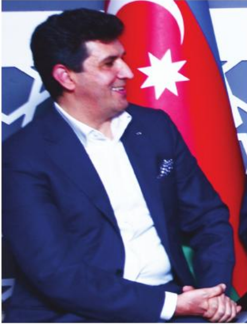
Əziz toplantı iştirakçıları, Hörmətli elm və sənət nümayəndələri, Hörmətli müəllimlər və tələbələr,

Sizləri Xəzər Universiteti tərkibində yaradılmış Mövlana Ədəbi Fəlsəfi Araşdırma Mərkəzinin açılış mərasimində görməyə çox şadıq.