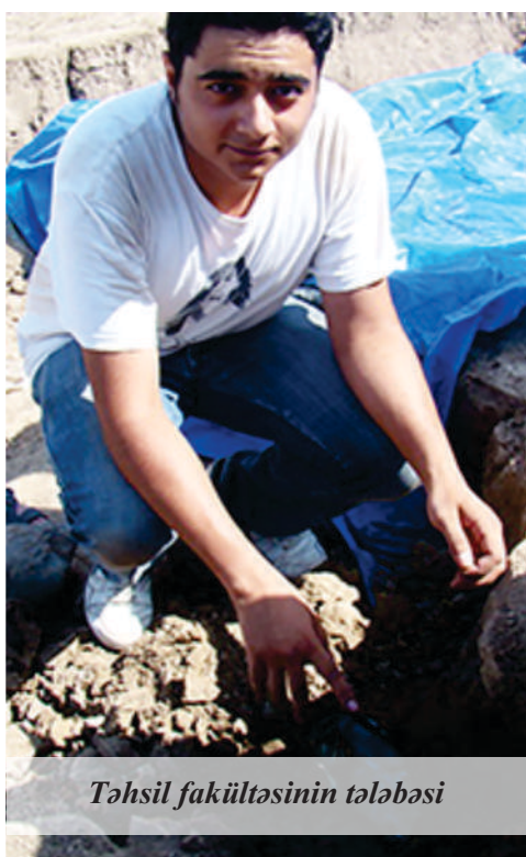
Təhsil fakültəsinin tələbəsi