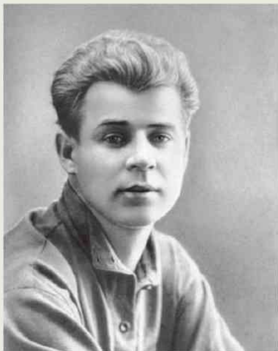
Сергей Есенин. Баку, сентябрь, 1924

Мардакяне. Об условиях, существующих и созданных там для Есенина, можно было лишь мечтать.