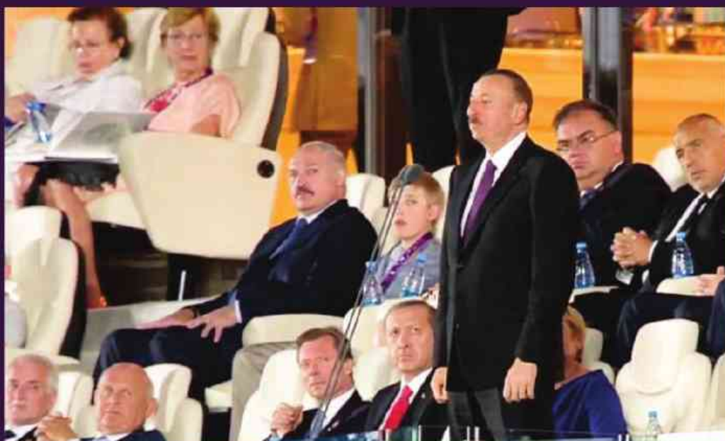
Azərbaycan Respublikasının Prezidenti İlham Əliyev Birinci Avropa Oyunlarını açıq elan etdi.