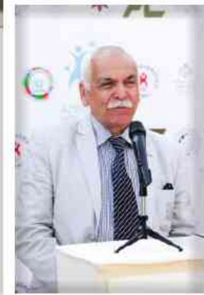
Arif Hüseynov Xalq rəssamı