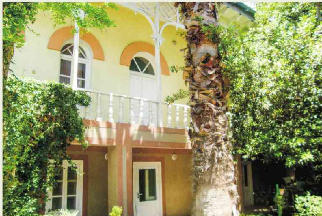
Дачный дом в Мардакяне. Летом 1925 года, в период пребывания в Баку, Есенин с невесткой Софьей Толстой жили здесь.

Конечно, жизнь в Баку не была совсем ровной, были и сложные дни, болезни, разочарования, ссоры с