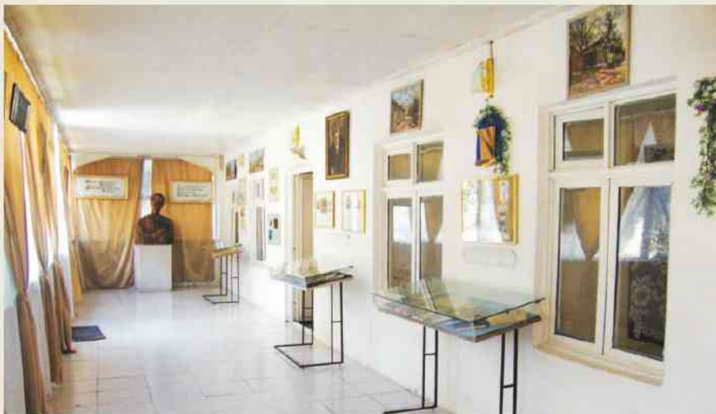
Дом-музей Есенина в Мардакяне. Функционирует с 1998 года