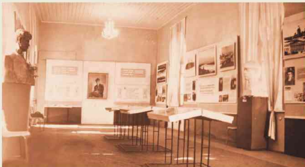
Комната-музей Есенина в Мардакяне. Функционировал с 1975 по 1990 год