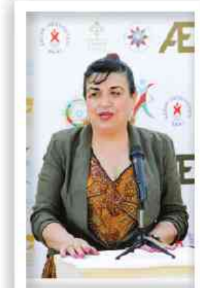
Afaq Kərimova Xəzər Universiteti